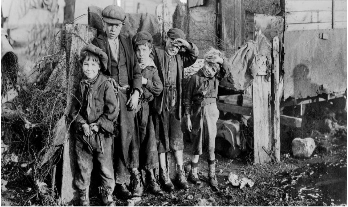
Un grup de xiquets en un barri pobre de París al voltant del 1900.

b) Observa aquesta fotografia i respon breument a les preguntes: