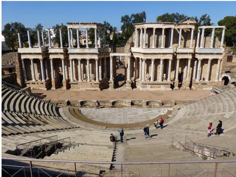
Teatre de Mèrida.

3.3. Observa aquesta fotografia i respon breument les preguntes: (1 punt)