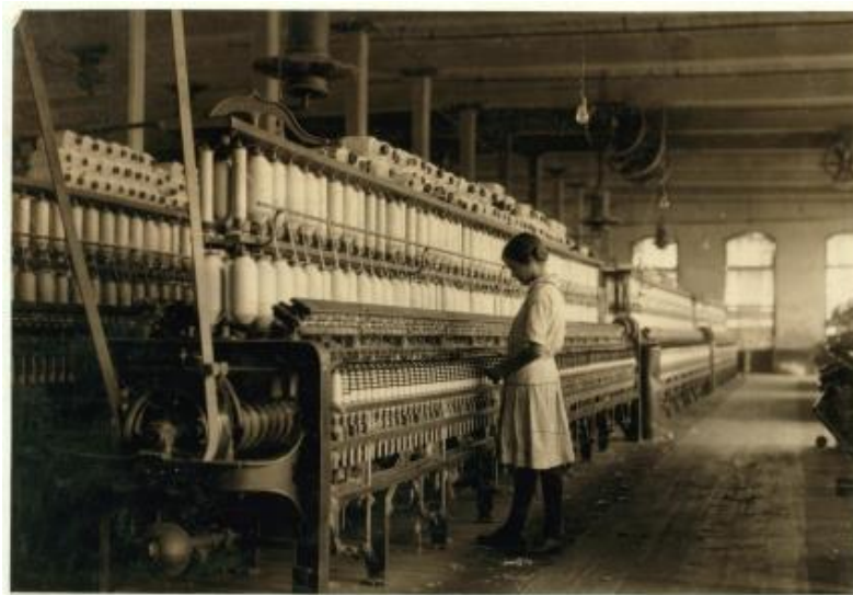
Niña de 14 años trabajando en una fábrica textil de EEUU. Fotografía de L.W. Hine (1913) Imagen en Library of Congress . Sin restricciones de publicación

3.2. Observa esta fotografía y responde brevemente a las preguntas: (1 punto)