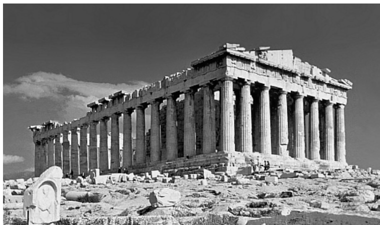
Imagen en Wikimedia Commons con licencia CC

Información gráfica 1: Observa la siguiente imagen y contesta las preguntas que figuran a continuación: