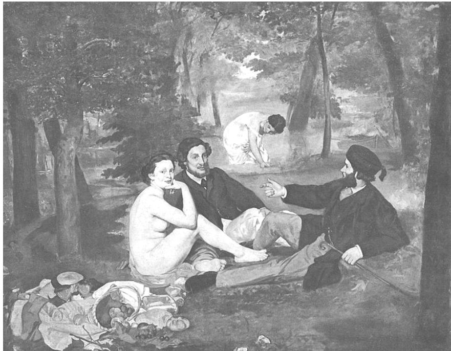
Imagen en Wikimedia Commons de dominio público

Información gráfica 1: Observa la siguiente imagen y responde a las preguntas que figuran a continuación: