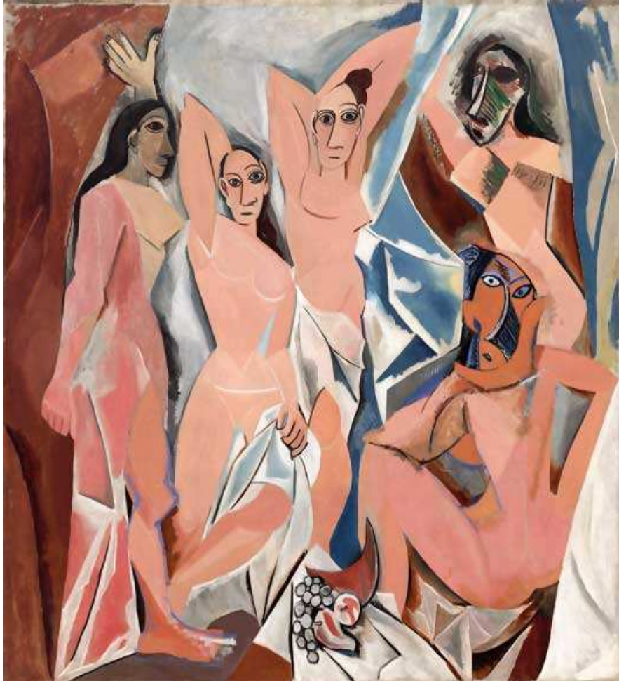
Imagen: Las señoritas de Avignon

7) Observe la imagen y responda las preguntas: