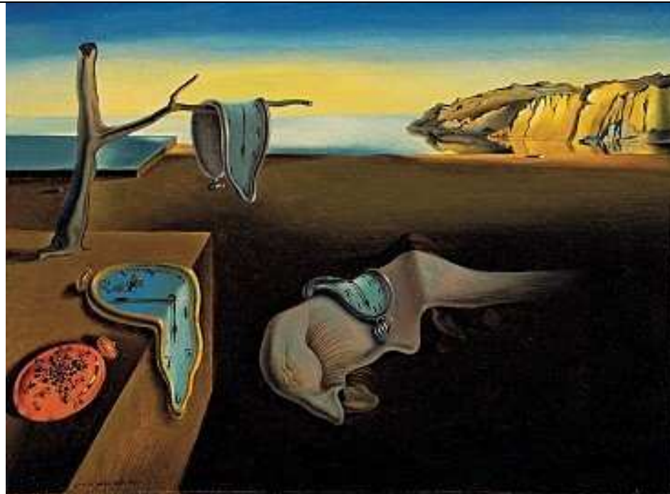
Imagen Nº 2

Observe la imagen y responda las preguntas: