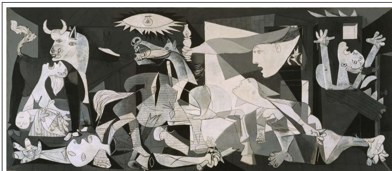
Imagen n.º 1. Imagen artística

Ejercicio 3: Observa la siguiente obra de arte y responde a las cuestiones que se plantean a continuación. (1,5 puntos; 0,5 puntos por respuesta correcta).