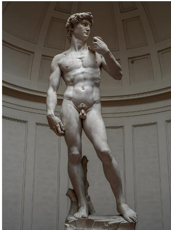
Imagen n.º 1. Imagen artística Fuente: Wikipedia https://upload.wikimedia.org/wikipedia/commons/thumb/8/80/M Licencia: Creative Commons

Ejercicio 3: Observa la siguiente obra de arte y contesta a las preguntas.