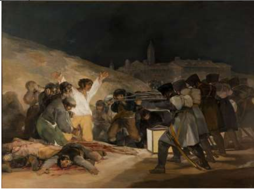
Imagen Nº 1 Fuente: Wikipedia Url:

Ejercicio 3. Observa la siguiente obra y contesta a las preguntas (1,5 puntos; 0,5 puntos por cuestión correcta).