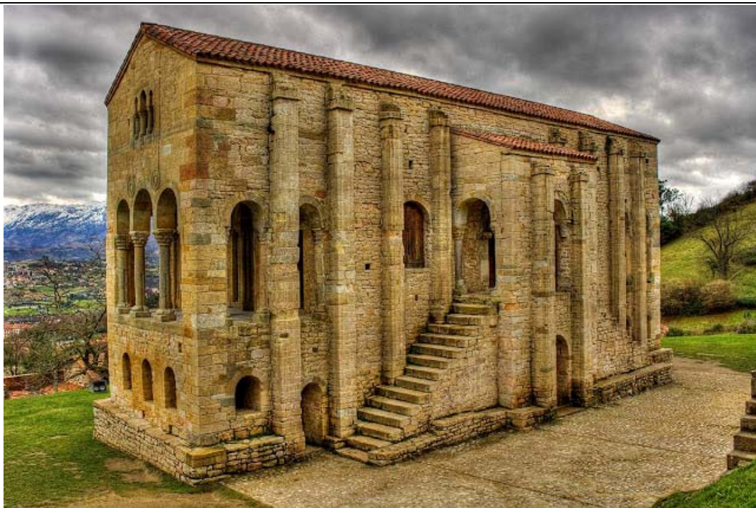
Santa María del Naranco.

Observe el documento 2 y luego responda a las preguntas que se formulan en relación con el mismo.