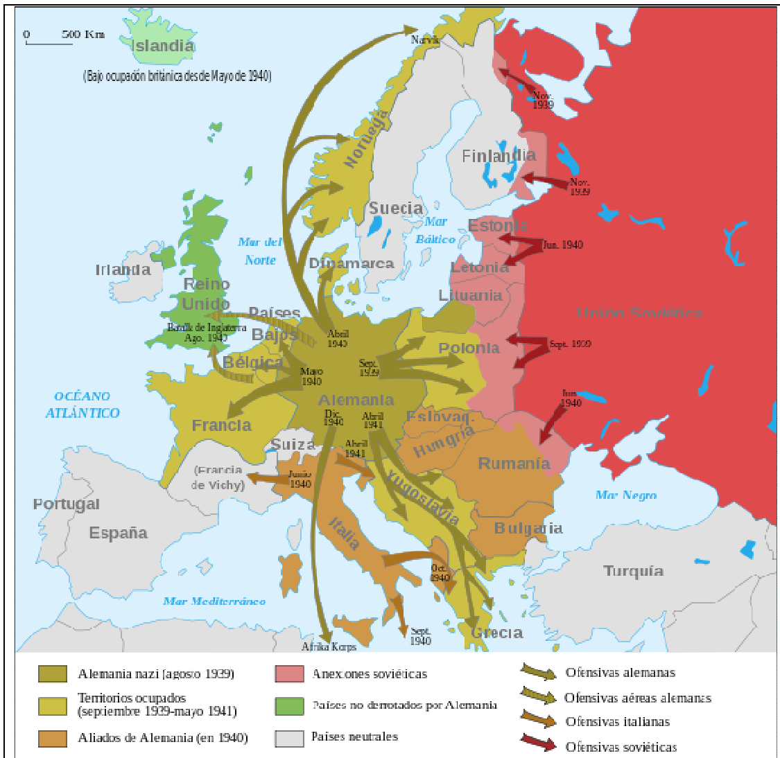
Imagen Nº 1. Mapa WW