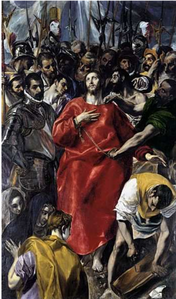
Imagen Nº 2: El Expolio

Observe la siguiente imagen y responda las cuestiones que se plantean.